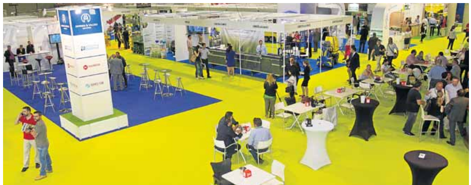
MORERA Y VALLEJO INDUSTRIAL. El amplio stand de Morera y Vallejo Industrial con los nombres de Plastimer y Macresur, tan queridos entre los agricultores almerienses, dominando el paisaje de Infoagro Exhibition. JUAN SÁNCHEZ

Una buena parte de la Almería agrícola está ampliamente representada en la primera edición de esta nueva feria