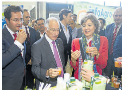
AMAT y el consejero en la feria. LA VOZ