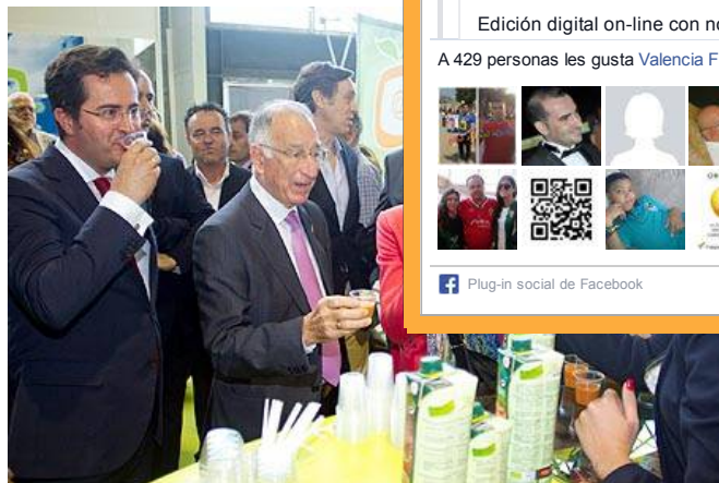
Visita a la feria Infoagro Exhibition 2015.

Asimismo, García Tejerina ha señalado que el Gobierno apoya el cooperativismo, donde las cooperativas de frutas y hortalizas tienen una enorme importancia. En este ámbito, “hemos apostado por la innovación, con la presentación del Programa de Innovación e Investigación para el Sector Agroalimentario, apostamos por la