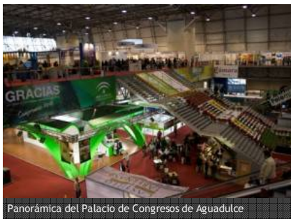
Panorámica del Palacio de Congresos de Aguadulce

Tu publicidad aquí, anuncia tu negocio en Almeria360, el Periódico Digital de Almería