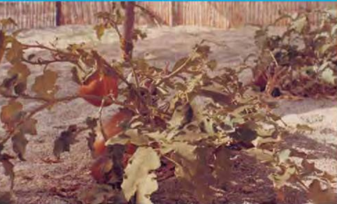
Primer invernadero de caña de la Finca Piloto