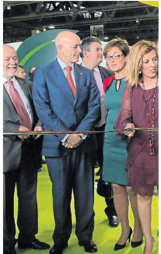
EL CONSEJERO inaugura la Infoagro Exhibition.