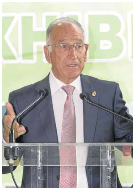
AMAT considera que la visita de la ministra de Agricultura supone un reconocimiento.

—He visto algunas novedades tecnológicas muy importantes. Una empresa