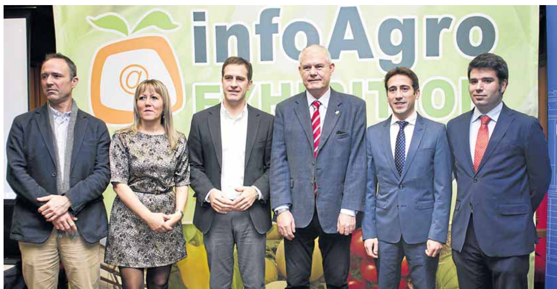
PRESENTACIÓN en la Delegación del Gobierno de la Junta de Andalucía del nuevo evento del sector hortofrutícola en Roquetas de Mar.

La segunda será una de las jornadas fuertes del evento ya que los promotores han anunciado que será entonces cuando se reciba la visita de la ministra de Agricultura, Alimentación y Medio Ambiente (MAGRAMA), Isabel García Tejerina.