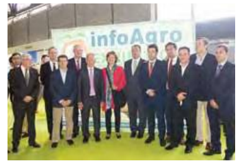
COMITIVA de organizadores y cargos públicos.