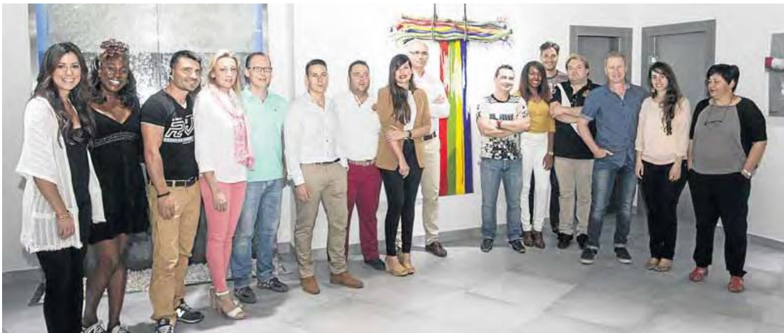
EQUIPO PROFESIONAL de Tabo Export, en sus oficinas centrales del Edificio La Celulosa, junto a una obra pictórica muy significativa de Waldi.