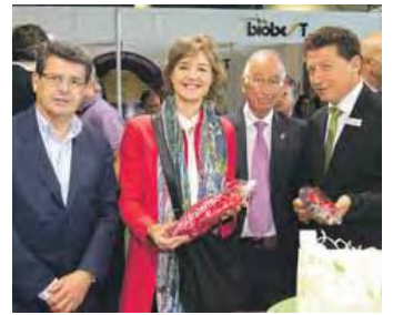
PARADA en uno de los estand del ferrial.