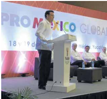
PROMEXICO presentará a los asistentes las oportunidades que ofrece México a la industria auxiliar almeriense.