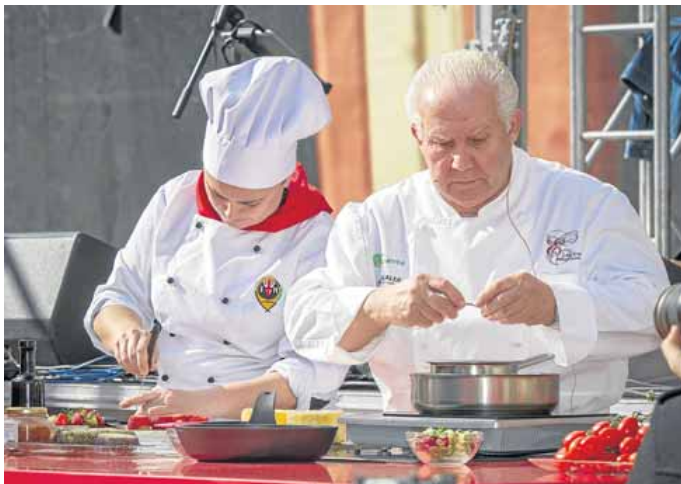
EL SHOWCOOKING se ha convertido en un elemento habitual de las ferias agrícolas.