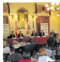
INFOAGRO tendrá un fuerte lado profesional.

La segunda jornada estará dedicada a la fertilización y la fertirrigación, con un