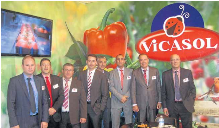
VICASOL en Fruit Attraction 2014, representada por sus directivos y su equipo profesional.

Vicasol también levantará su stand en la feria Infoagro Exhibition, con el convencimiento de que "es necesario estar en este tipo de eventos", como explica el presidente González Real, quien está seguro de que es necesario apoyar este tipo de eventos que, por unos di-