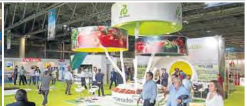
RIJK ZWAAN. Espectacular imagen del stand de Rijk Zwaan, con la novedad de los california de ciclo largo.