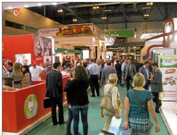
Imagen de archivo de una feria agrícola.

Roquetas de Mar había sido tradicionalmente el punto de encuentro de los agricultores con las empresas del sector pero desde hace unos años, con la transformación vivida por la Expo Agro, no cuenta con una feria del calibre de las que tradicionalmente acogía el Palacio de Exposiciones y Congresos de Aguadulce.