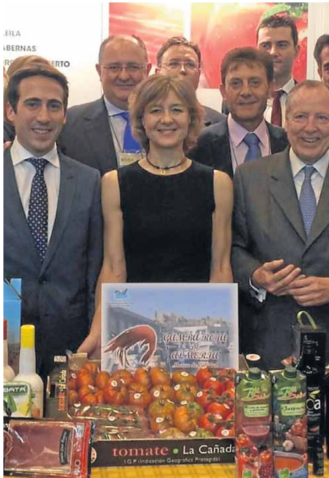
LA MINISTRA García Tejerina en la inauguración de Fruit Attraction.

En efecto, de forma paralela al programa de conferencias, esta convocada en la misma jornada inaugural un acto en el que será dada a conocer la plataforma digital Naturcode, que es fruto de la colaboración de la Consejería con la prestigiosa firma Semseo Estrategia Online.