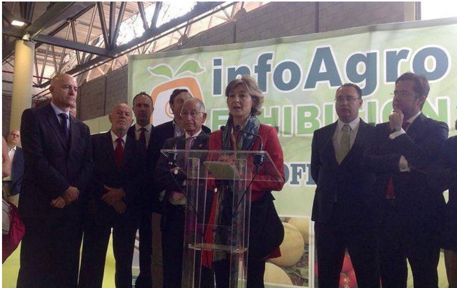
García Tejerina en Infoagro Almería.

OBSERVACIÓN: La Información ofrecida a continuación ha sido obtenida mediante un sistema de búsqueda en Internet a petición del usuario. Su titularidad corresponde a la Web de origen Fuente salvo lo dispuesto en la misma. Ver Aviso Legal .