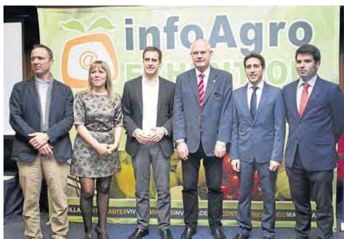
PRESENTACIÓN de la nueva feria agrícola en la Diputación Provincial (derecha) y en la Delegación del Gobierno de la Junta en Almería.