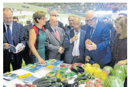
VISITA al expositor de la Universidad de Almería.