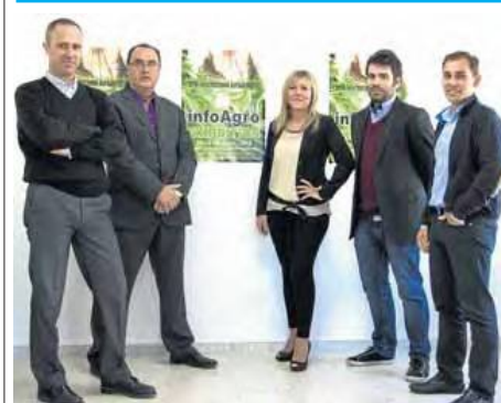
LOS ORGANIZADORES en las primeras fases del lanzamiento de este proyecto.

Cadena Ser Provincia de Almería desarrolla una intensa actividad en cuanto a la realización exterior, siempre muy cerca de la actualidad de Almería, recorriendo la geografía provincial y el calendario de eventos y acontecimientos más destacados, con el fin de ofrecer a su audiencia el testimonio más directo de la actualidad.