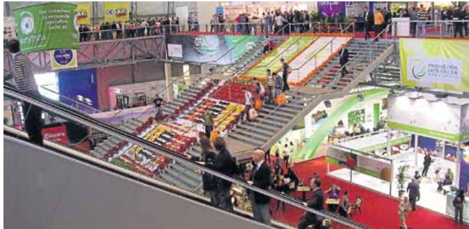
IMAGEN de la última Expo Agro celebrada en el Palacio de Aguadulce, la de 2012.

Desde InfoAgro se asegura que a fecha de hoy ya se ha cubierto un 60 por ciento del espacio disponible, con un listado que incluye por