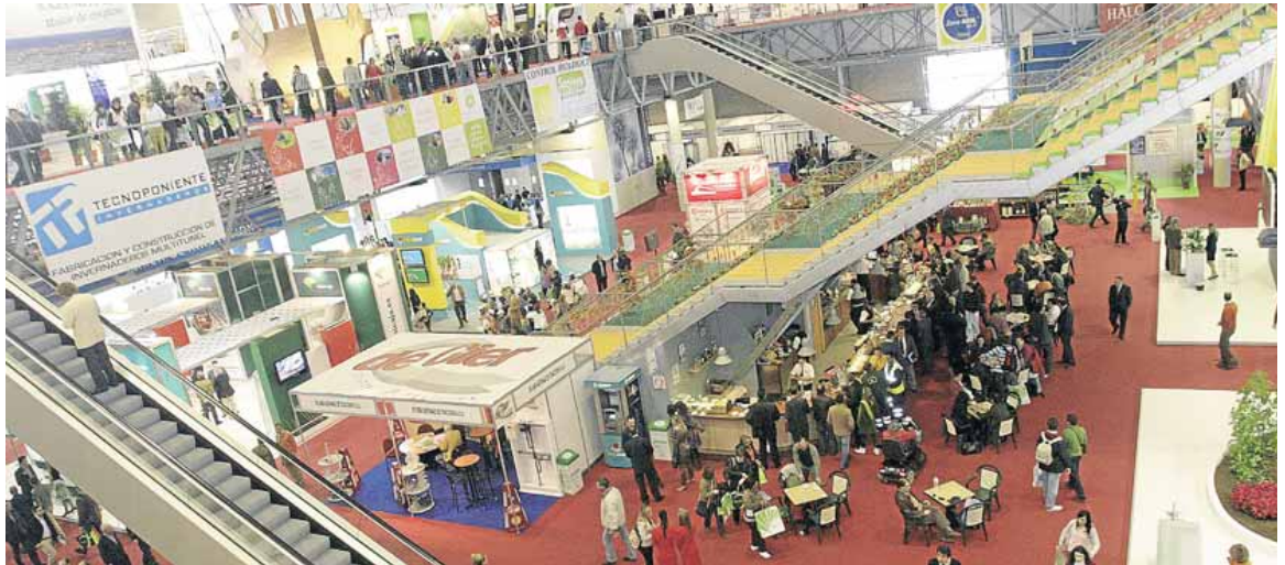
ALMERÍA quiere recuperar su papel como punto de encuentro de las innovaciones hortícolas que ya tuvo con la Expo Agro.

Almería, un coloso de la producción, ha quedado en los últimos años relegada en la organización de eventos de nivel en el segmento de la comercialización, sobre todo tras la desaparición de la Expo Agro y de la pujanza de otras ferias internacionales como Fruit Logística y Fruit Attraction.