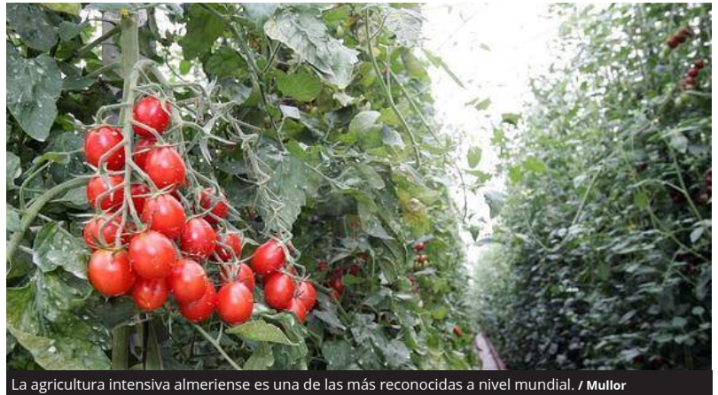
La agricultura intensiva almeriense es una de las más reconocidas a nivel mundial.

Quedan unas cuantas semanas hasta que llegue la fecha, pero los organizadores de la primera feria internacional 'Infoagro Exhibition' vendieron ayer en