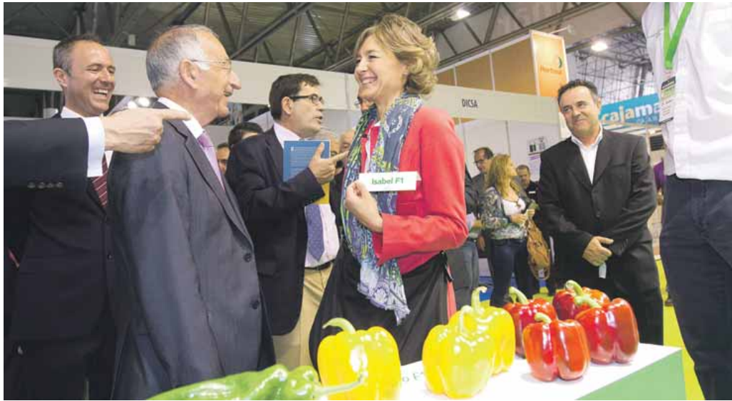
LA MINISTRA en su recorrido por la feria encontró una variedad de hortaliza bautizada con su mismo nombre. JUAN SÁNCHEZ