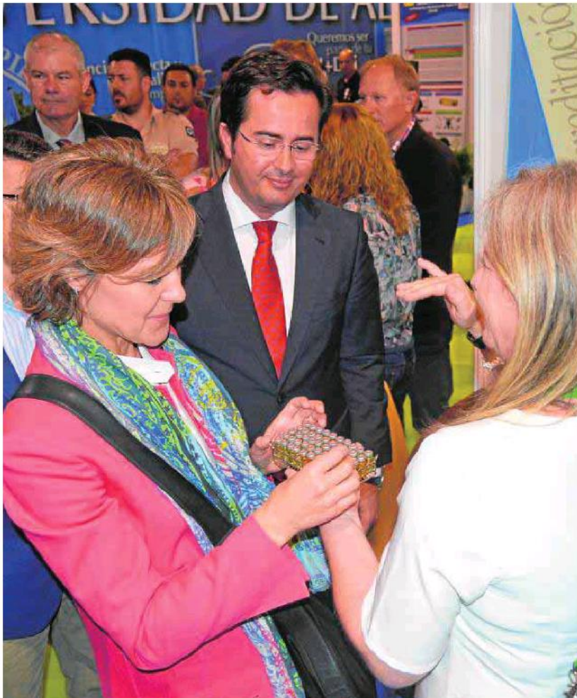
La ministra, acompañada por el alcalde de El Ejido, atiende a una profesional del Cuam.

La ministra de Agricultura refrendó en Infoagro Exhibition el apoyo del Ejecutivo a la actividad agrícola y ganadera de Almería