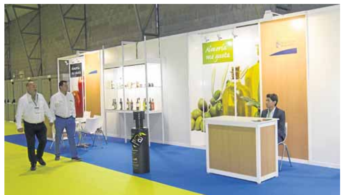
STAND DE LA DIPUTACIÓN en la feria Infoagro Exhibition.

La Diputación de Almería, a través del área de Agricul-