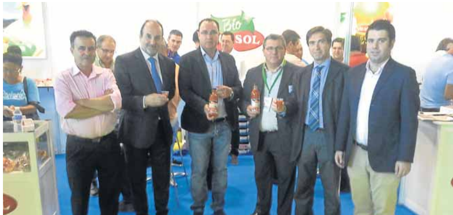
UN BRINDIS por el éxito futuro de las ferias agrícolas almerienses en el stand de Vicasol.

Pero, de momento, queda aún digerir lo que han dado desi estos tres días. Especialmente para Vicasol, que comenzó recibiendo el primer día uno de los premios concedidos por Infoagro Exhibition, para continuar con la entrega del galardón que le concedió el Colegio de Eco-